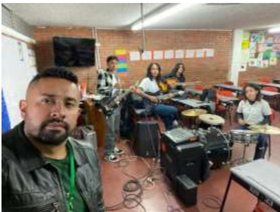
COLEGIO JJ CASAS (BANDA 1)