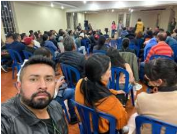
REUNION DEL GRUPO DE DOCENTES DE LA CASA DE LA CULTURA CON EL SEÑOR ALCALDE PARA LA PRESENTACION DE LA NUEVA DIRECTORA DE CULTURA.