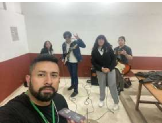
COLEGIO LAURA VICUÑA (BANDA 2)