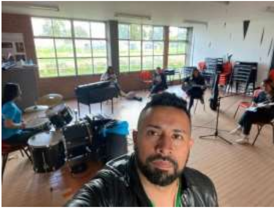
COLEGIO FAGUA SEDE TIQUIZA.