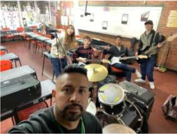
COLEGIO JJ CASAS (BANDA 3)