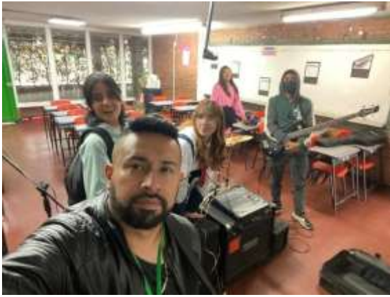
COLEGIO JJ CASAS (BANDA 2)