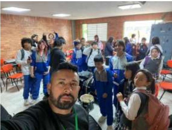
COLEGIO DIOSA CHIA.