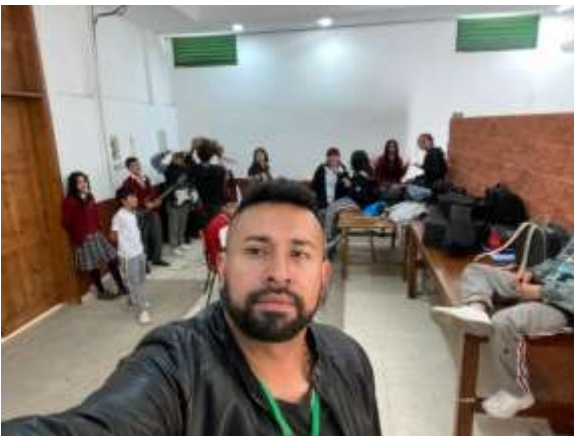
COLEGIO LAURA VICUÑA (BANDA 1)