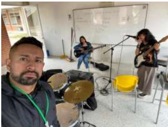
COLEGIO FAGUA SEDE PRINCIPAL.