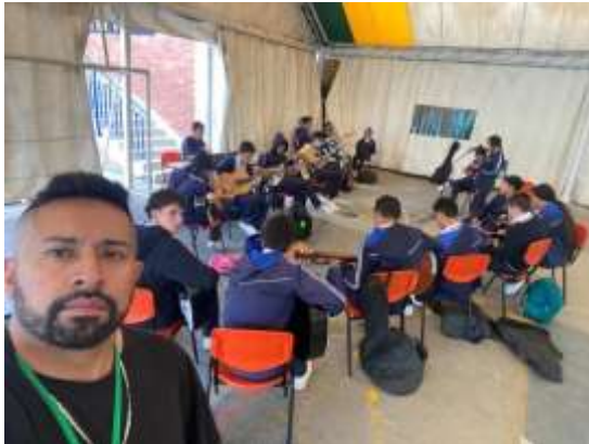
COLEGIO SANTA MARIA DEL RIO.