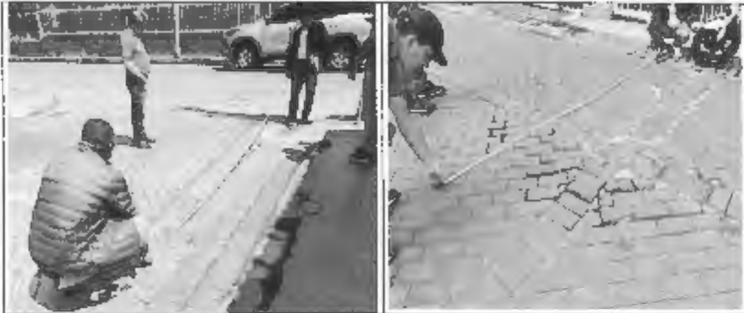
Figura 4: Medidas en el sector de parque rio frio.