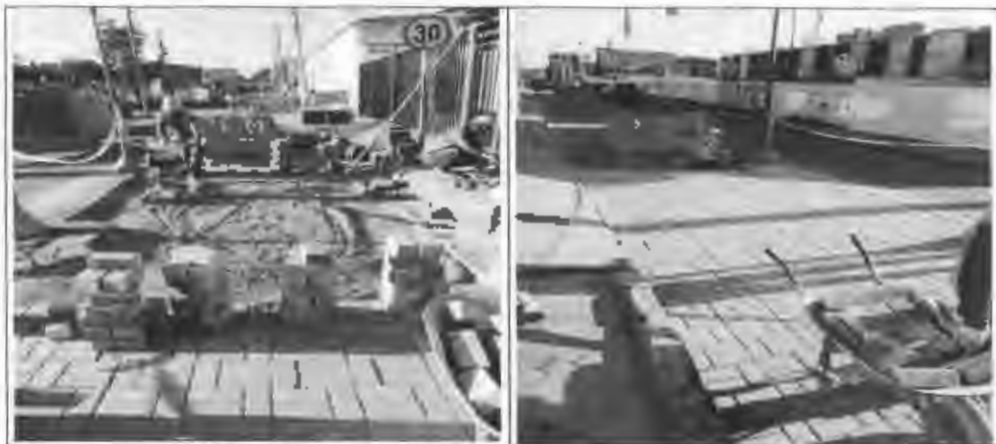
Figura 23: Adoquín de concreto en Santa Lucia.