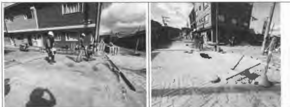
Figura 20: Adoquín de concreto en Santa Lucía.