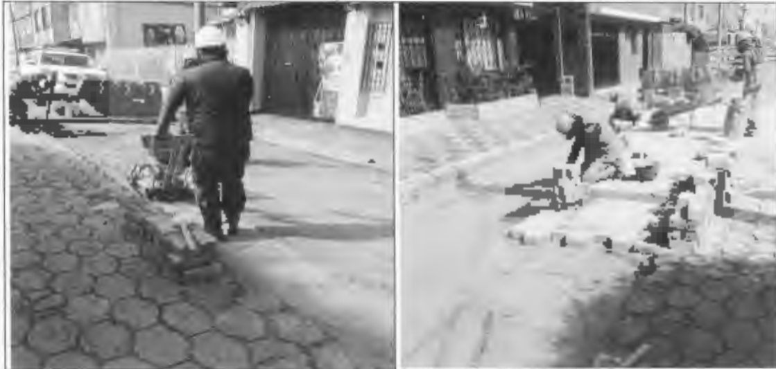
Figura 25: Adoquín de concreto en Santa Lucía.