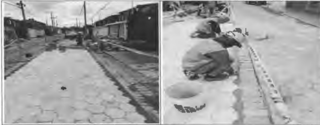
Figura 16: Instalación adoquín de concreto parque rio frio.