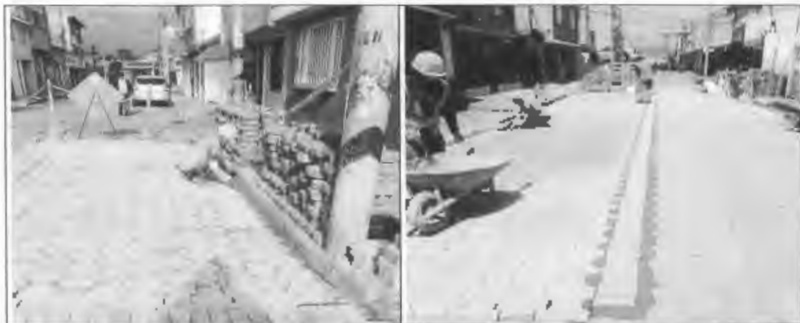
Figura 26: Adoquín de concreto en Santa Lucía.