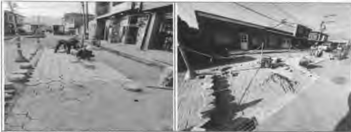
Figura 22: Adoquín de concreto en Santa Lucia.