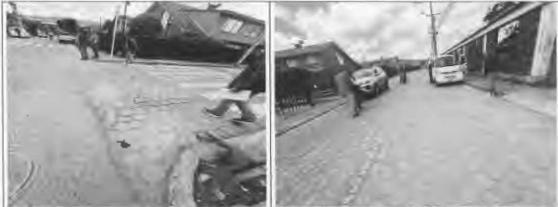
Figura 7: Medidas en el sector del 20 de julio.