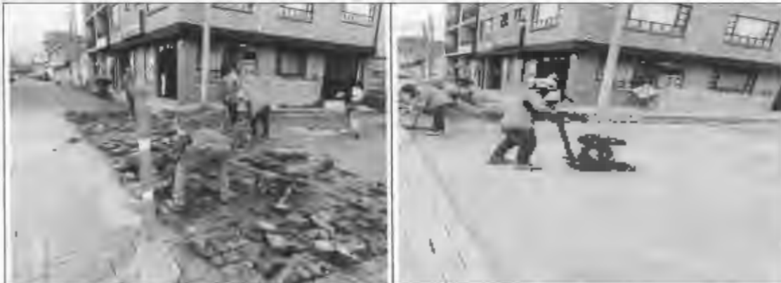
Figura 19: adoquín de concreto santa lucia.