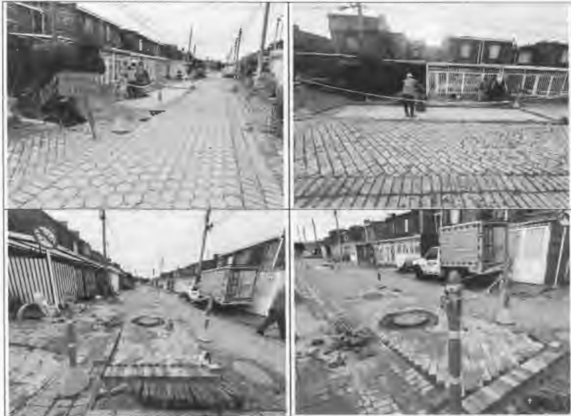
Figura 15: Instalación adoquín de arcilla parque rio frío.