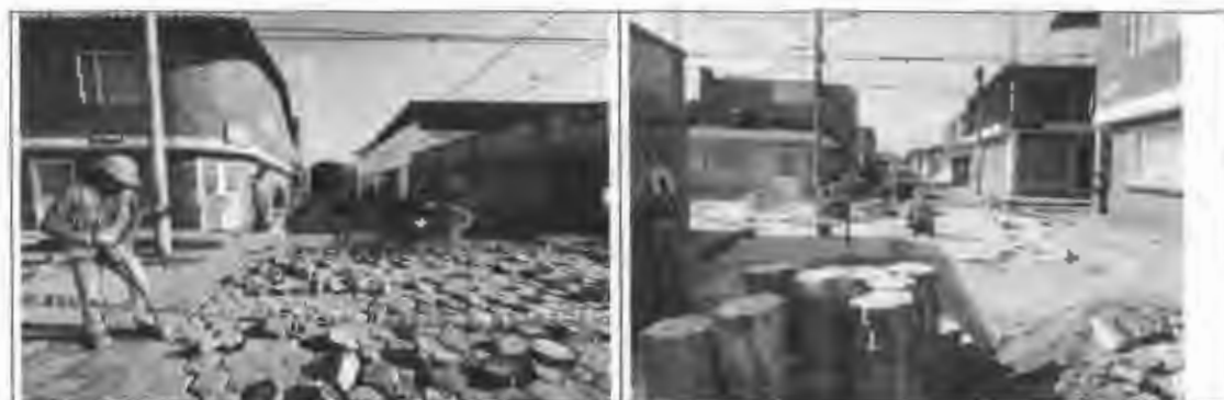
Figura 24: Adoquín de concreto en Santa Lucia.