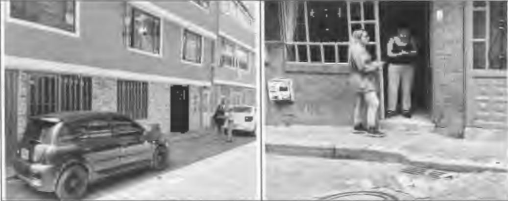
Figura 9: Actas de vecindad, la primavera.