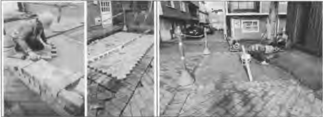
Figura 13: Instalación de adoquín en arcilla, la primavera.