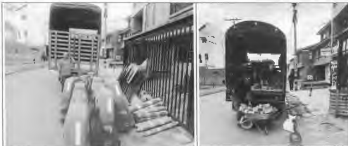
Figura 12: Actividades Preliminares, acopio de señalización y material.