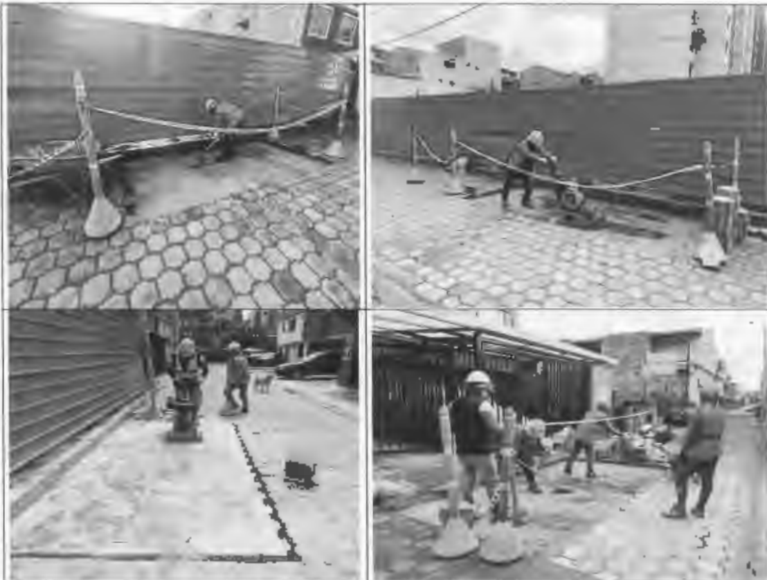
Figura 14: Instalación de adoquín en concreto, la primavera.