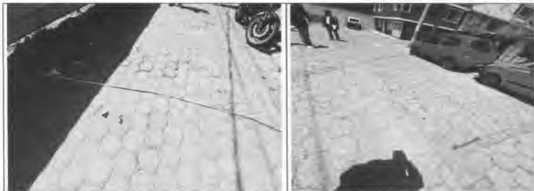
Figura 5: Medidas en el sector de Ibaro.