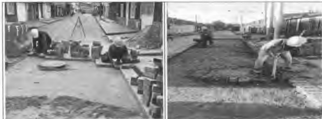
Figura 17: Instalación de adoquín de concreto en el sector de santa lucía.