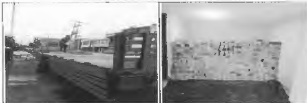
Figura 11: Actividades Preliminares, acopio de material.