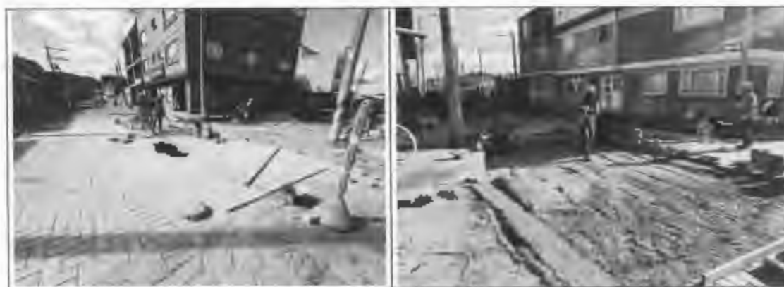
Figura 21: Adoquín de concreto en Santa Lucía.