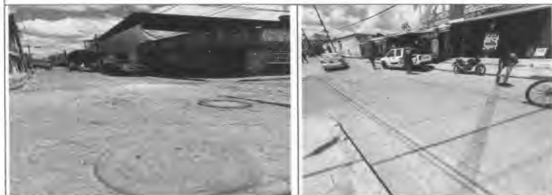
Figura 6: Medidas en el sector de Santa Lucia.