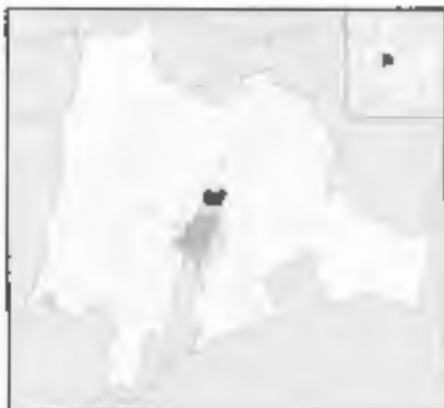
Figura 1: Municipio de Chía en el departamento de Cundinamarca.