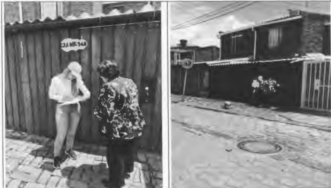
Figura 8: Actas de vecindad, parque río frío.

Se realizaron actas de vecindad y socialización a la comunidad de cada uno de los sectores a intervenir.