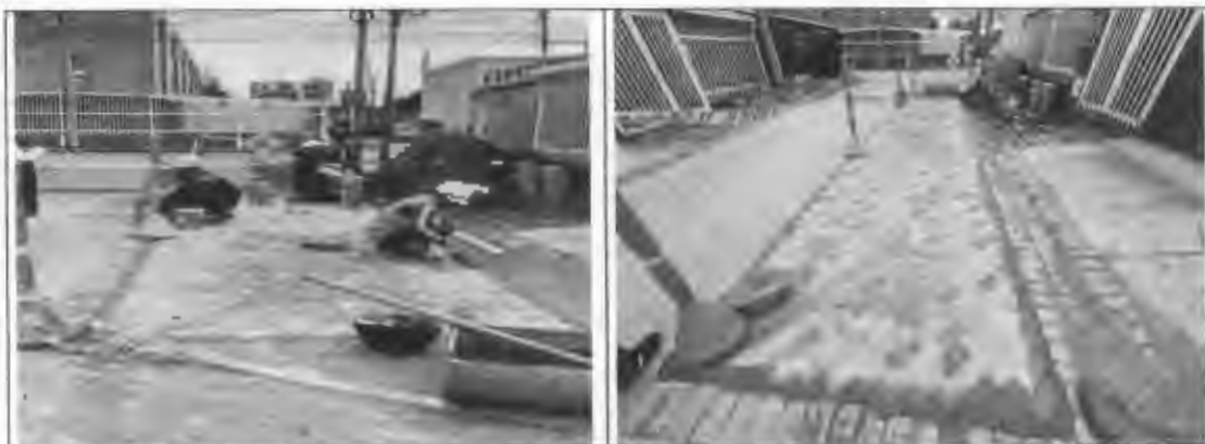
Figura 18: Adoquín de arcilla en el sector de rio frio.