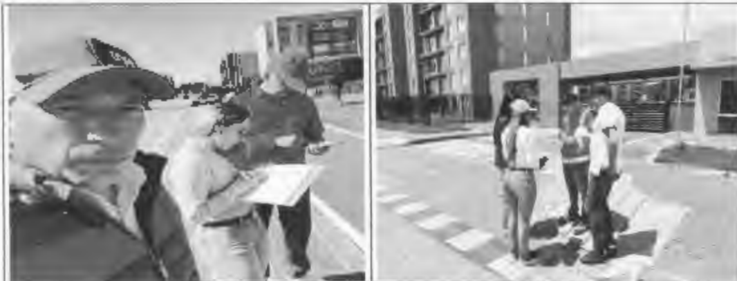
Figura 10: Actas de vecindad, 20 de julio.