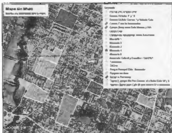
Figura 2: Municipio de Chía, sectores a intervenir.